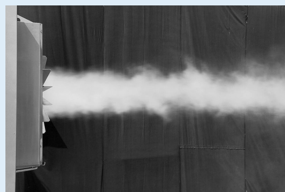
GHF mit Güntner Streamer