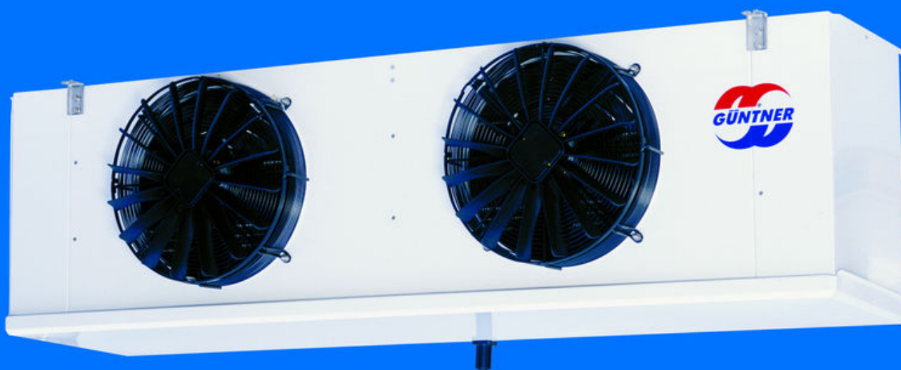
Hocheffizienter Wand-/Deckenluftkühler GHF mit Güntner Streamer

Das von Güntner entwickelte Nachleitrad Güntner Streamer wurde am Institut für Luft- und Kältetechnik Dresden (ILK) genau auf seine Eigenschaften untersucht. Eine Zusammenfassung der Tests und Ergebnisse zeigt, welche Vorteile der Güntner Streamer beim Betrieb von Standard-Luftkühlern bringt.