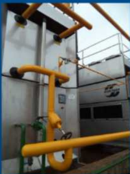
Güntner ECOSS NLA3 auf dem Gebäudedach