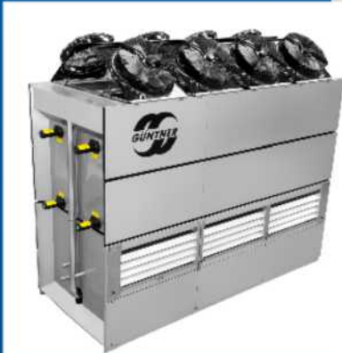
Güntner ECOSS NLA3

Die innovative Lösung garantiert einen maximalen Schlachtkörper-Gewichtsverlust von maximal nur 1,7 %; der Gewichtsverlust des alten Systems betrug hingegen 2,3 %. Die neue Technik verhindert tägliche Verluste in Höhe von ca. 6.450 US-Dollar; pro Jahr summiert sich der Effekt auf 2.320.000 US-Dollar.